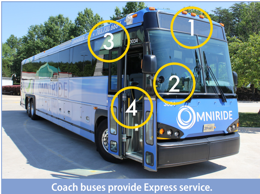
Coach buses provide Express service.